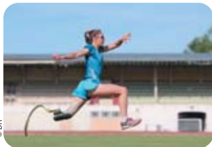
Marie-Amélie Le Fur à l'entraînement.