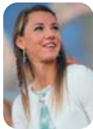
Marie-Amélie Le Fur, marraine de l'événement.

Mutame & Plus soutient l'équipe Départementale Sport et Handicap de la Manche qui organise deux journées de sensibilisation Sport-Handicap à Coutances et Montmartin-sur-mer les 12 et 13 octobre 2018. L'événement est parrainé par la multi-médaillée paralympique Marie-Amélie Le Fur.